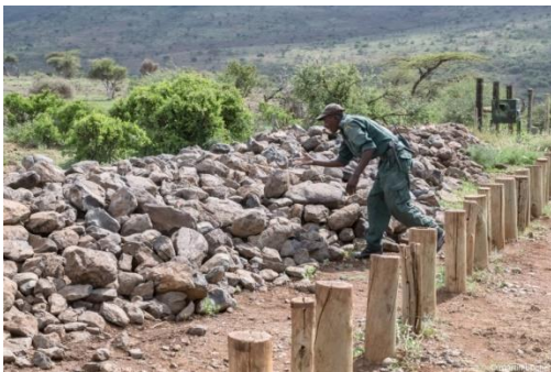
Bild oben: Schleuse für wandernde Wildtiere. Am Zaun (rechts oben) ist eine Fotofalle montiert. Die Holzposten im Vordergrund und der Steinwall hindern die Nashörner, das Gebiet zu verlassen, das wegen dem Druck der Wilderei.

Die wenigsten Safariteilnehmer in Afrika aber auch die nichtreisende Gesellschaft hier wissen, dass es die immer schöngeredete „goldene Freiheit“ für die Wildtiere auf dem Dunklen Kontinent längst nicht mehr gibt; etwas was uns Bernhard Grzimek voraus war und schon vor 60 Jahren prophezeite.